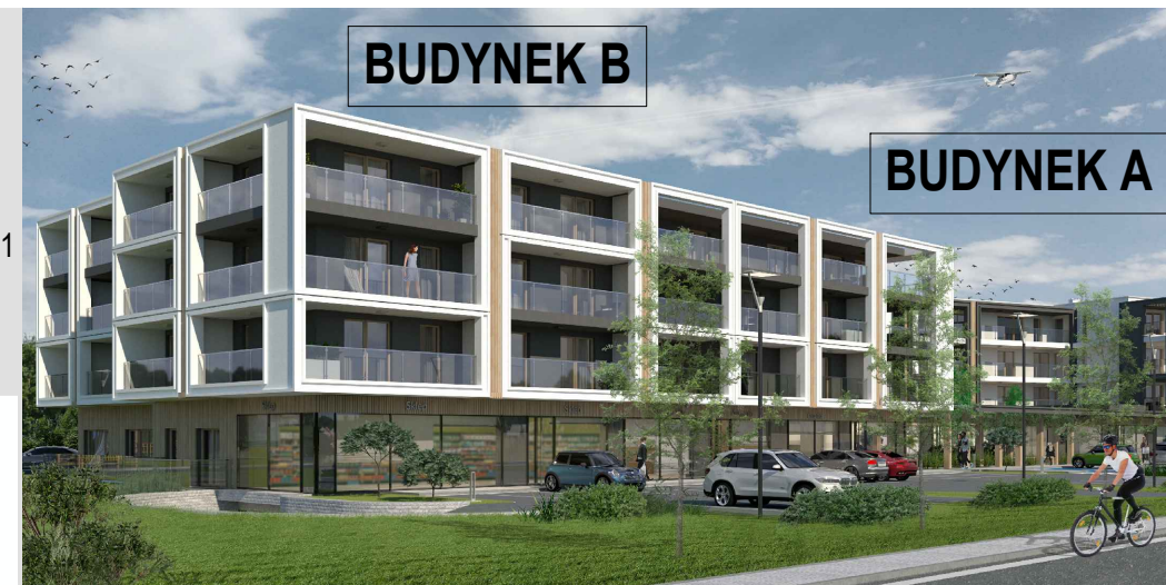
RÓG ULICY MŁYŃSKIEJ I LUDWIKA WARYŃSKIEGO W BUSKU ZDRÓJU

BIURO SPRZEDAŻY: WJAP INVEST SP. J. ul. Bohaterów Warszawy 31 28-100 Busko Zdrój tel.: + 48 505 666 969 nowadzielnica@wjap.pl